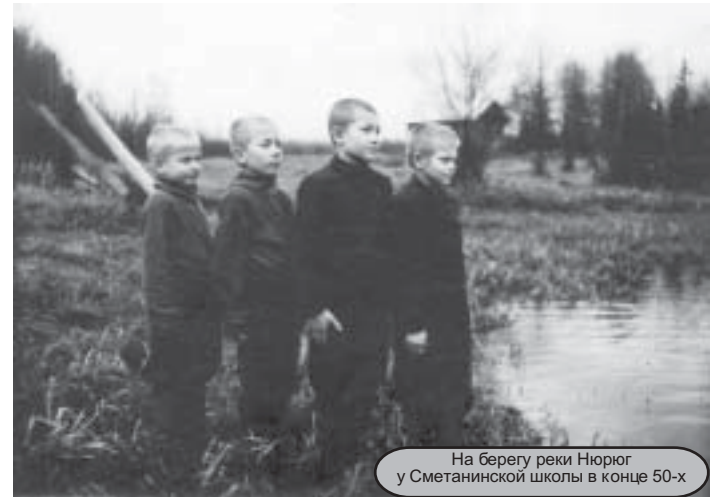
На берегу реки Нюрюг у Сметанинской школы в конце 50-х

«Живу я хорошо, у меня отдельная комната, ни в чем не нуждаюсь. Одно плохо, к внуку меня не допускают», - писала она своей землячке Настасии в Ветлужский.